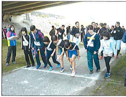
新田橋の下でスタート

3月2日(土)、10時から好天の下で、今年の「上井地区マラソン・駅伝大会」が開催されました。駅伝の部では、倉吉北高校野球部の皆さんが、2チームを組んでオープン参加。大会を盛り上げてくれました。