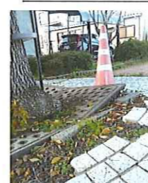
遊歩道のクスノキ

にはクスノキが5本植えてあります。その内の1本は、根元が数センチ上がり化粧タイルを突き上げ崩壊寸前状態です(写真=左)。