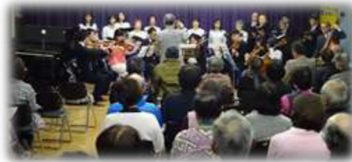
たくさんの方にご来場いただき、ありがとうございました。