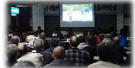
自治公民館役員としての役割を再度確認し、生田の実践事例や真備町の水害事例から学び、今後の各自治公民館活動に生かしていくことを目的に開催されました。