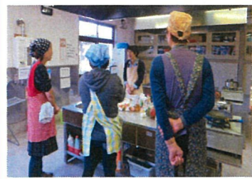
(上段) 真剣に聞く参加者

この日のメニューは、ビタミンやミネラルが豊富な食材を使った黒米のきのこドリア、わかめの味噌汁、サラダと体を温めるりんごのくず煮でした。