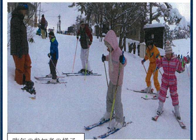
昨年の参加者の様子