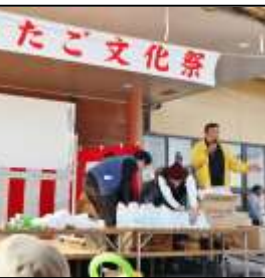
良いものが当たりましたか？