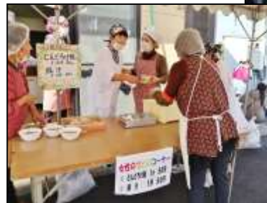
女性のつどいによる どんどろけ飯と豚汁は 今年も大人気でした。