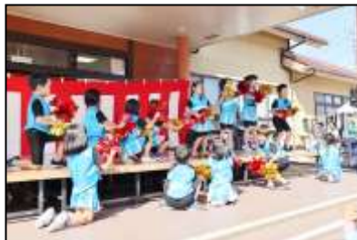
園児達の可愛いダンスに観客皆が笑顔に♪