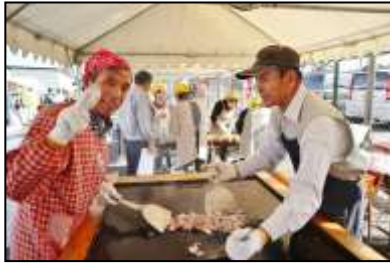
屋台も大繁盛の大忙し！

今年も晴天にも恵まれ、2日間で約760人もの来場があり、作品展示、ステージ発表、屋台等、大賑わいでした。たくさんの来場ありがとうございました！ 役員のみなさま、ご協力ありがとうございました。