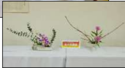
今年も素敵な作品をありがとうございました！