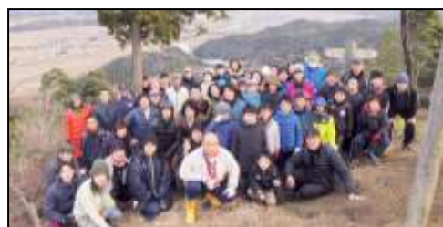
あたご山の頂上でパシャリ！ (平成30年1月1日)