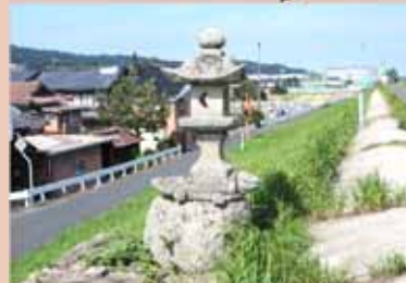
『下田中の金比羅灯籠』