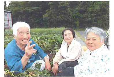
おばあちゃんとお仲間たち