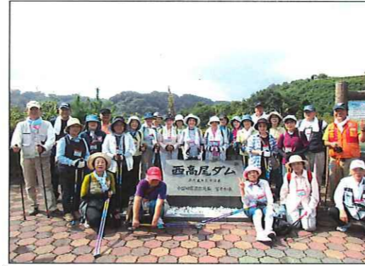
レークサイドの広場で 記念写真

仲間と栗の実や萩の花を見ながら秋を感じて歩くと、約3Kmも大丈夫。途中、キレイな空気の中を歩いていると野生の鹿が現れるというパブニングもありましたが、思い出に残る1日となりました。楽しく運動ができてバッチリ!でした。