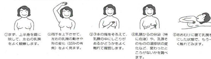
乳がんのセルフチェック-自己検診のしかた

乳がん患者は年々増加傾向にあり、日本人女性の12人に1人が乳がんになるといわれています。しかし、乳がんは早期発見・治療により他のがんに比べて治る可能性が高く、自分で発見できる数少ないがんのひとつです。検診がない間のセルフチェックが早期発見には非常に重要です。検診に加えて、月1回のセルフチェックを習慣にしましょう。また異常がみられた際は、速やかに乳房疾患を専門とする医療機関を受診しましょう。