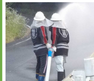
筒先をしっかり握って火点めがけて放水中!

高城は他地区ではすでに廃止されてしまった出初式や一斉放水を今も継続して実施されています。また夏季火災訓練も永年にわたり重要な訓練として毎年実施されています。そんな中、岡地内で実施された今年の夏季火災訓練には、総勢243名の出動を得て、岡、福積、般若・椋波連合、上福田の各分団による本番さながらの機敏な操法で火点への放水が行われました。実施分団の皆さんはもちろん見学分団の皆さんもご苦労様でした。連日の猛暑で異常な乾燥状態が続いていますので、火気の扱いには細心の注意を払いましょう。