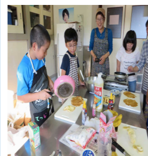
「上手だよー」フライパンを持つ手も様になる