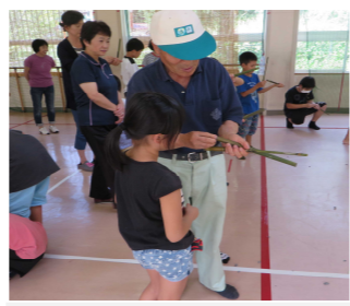
「こう詰めるんだよ」