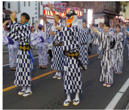
花の倉吉 椿音頭ですよ