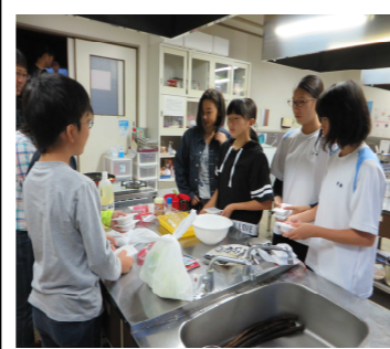
中学生のOGが初めて参加「先輩たちを身ならわんとね」