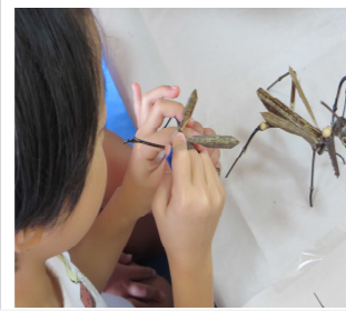
ポンドつけたら離さない