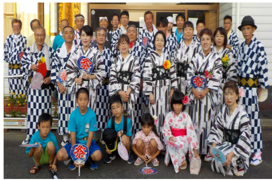
「いざ出陣!」やる気満々のスマイル

バス通りに響きわたる、やる気満々「スマイル高城」総勢34名の迫力ある掛け声と、今年の異常な暑さをも吹き飛ばす気合十分の踊りは、最後の最後まで衰えることなく踊り切ることができました。残念ながら賞はいただけませんでしたが、歩道を埋める多くの見学者からは「高城の踊りが一番いいぞ」「婚活の横断幕もいいなあ」という声を掛けていただきました。そして、賞の対象となった踊り子連はすべて50名以上の大所帯だということを考えると、踊りの質や掛け声の大きさだけでなく、やはり人数の確保も重要だということを痛感せずにはおられません。近年、地域活動の衰退化が顕著になり、行事が縮小や廃止に追い込まれています。このような状況を憂いているだけでは子どもたちに将来の夢を話す事ができるか疑問です。多忙化、価値観の多様化、生活スタイルの変容等、要因は様々ですが、自身のステップアップや地域とつながる機会を創出してみたいかですか。現在「スマイル高城」へ参加し実行委員として活動するスタッフを募集しています。