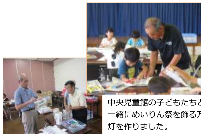
中央児童館の子どもたちと一緒にめいりん祭を飾る万灯を作りました。