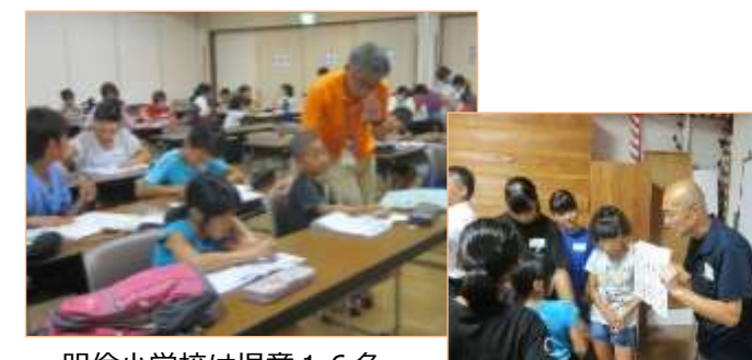
明倫小学校は児童16名の参加があり、高校生ボランティアの皆さんと一緒に夏休みの宿題に取り組みました。