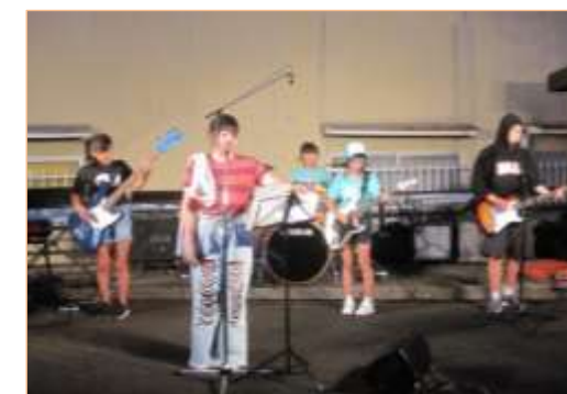
めいおん8期生「Jelly☆fish」の門出ライブが河原町地藏まつり会場にて盛況に開催されました。