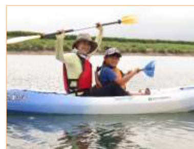
今年は全学年を対象にカヌー体験を行いました。