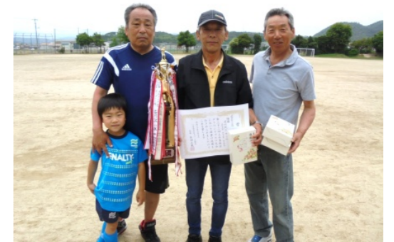
優勝した古川沢③チームは、2連覇!

大会前の数日間はずっと雨で開催も危ぶまれましたが、予定どおりの日程を終えることが出来ました。連日の雨で状態があまり良く無かったグラウンドでしたが、運営委員、会長、スポーツ推進委員のみなさんが丁寧にトンボかけをされ、準備万端で大会が始まりました。