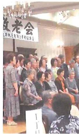
「久しぶり〜」(町内毎に記念写真:式典前)

ト리는、〈のぞみバンド〉のレベルの高いサクソとピアノによる演奏でした。情感いっぱいの「川の流れるように」の演奏が流れ、会場全体を引き込む見事な演奏でした。(T)