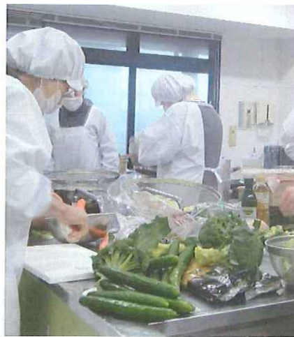
工夫された献立。調理風景

月2回、ひとり暮らしのお年寄りの方に「ふれあい給食」が届けられます。41名の「給食ボランティア」の協力で調理されたお弁当は、各町内ごとの「配送ボランティア」によって届けられています。調理・配送する人の思いを伝えます。