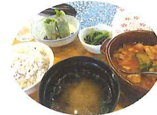
この日の薬膳料理

6月19日(火)AKB教室が開かれました。講演を聞き実際に薬膳料理をいただきました。