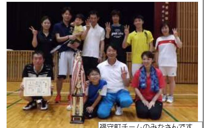
福守町チームのみなさんです。おめでとうございます

《ビデオプロジェクター・モバイルスクリーン》 各1台をご寄贈いただきました。 大変ありがとうございます。