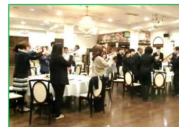
1年間よろしくお願ひします！ カンパイ☆

ホテルセントパレス倉吉にて『北谷を語る会』が開催されました。保育園、小学校の先生方の歓送迎会も兼ねており、普段あまりお話する機会のない地域の方々との交流の場として恒例の行事となりました。短時間ではありましたが、多くの御参加をいただきありがとうございます。