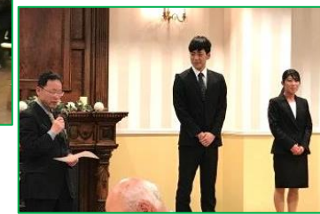
フレッシュな新任の先生のご紹介♪