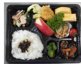
心のこもった温かいお弁当をお届けします。