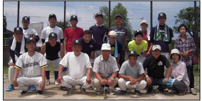
優勝した上古川チームは 10月に行われる市民体育大会に出場。