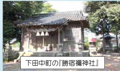
下田中町の『勝宿禰神社』