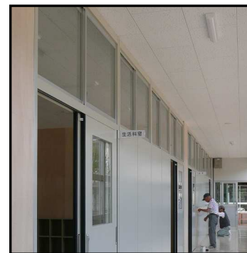
「学校へ行こう！」は9月から仮校舎1階の生活科室で行います。