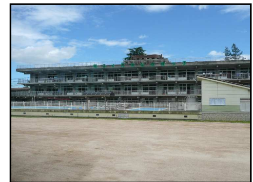
仮校舎の廊下側から見た東校舎