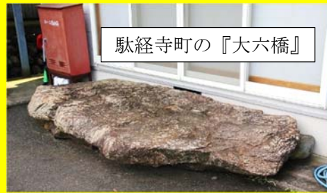
駄経寺町の『大六橋』