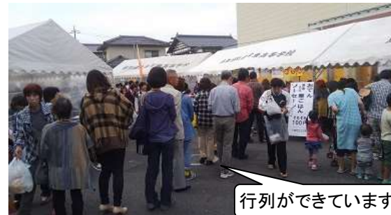
行列ができています

今年もくらよう祭に「小鴨公民館 大人の子ども会」メンバーで模擬店を出店しました。