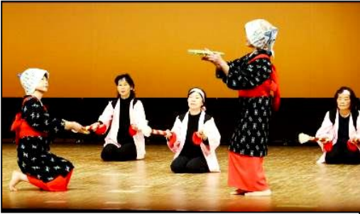
とっても盛り上がった 「あたごハッスル隊」の上小鴨流安来節&銭太鼓

12月3日～5日までの3日間、倉吉未来中心で開催しました。 たくさんの方に見に来ていただき、ありがとうございました。