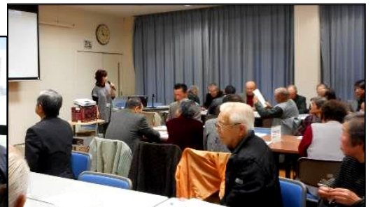
講師の話に耳を傾ける参加者のみなさん