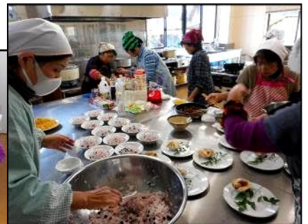
和気あいあいと楽しく調理しました。