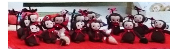
干支をモチーフにした「おさるさん」手芸教室さんの作品♡