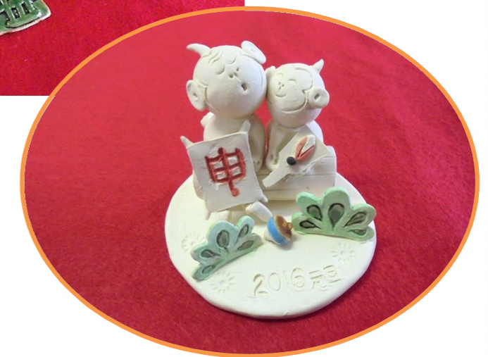
くらぶ悠・遊・友 陶芸教室作品