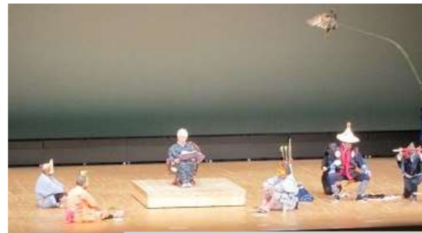
まなびば・おがも&おがも笑劇団

3日~5日は、アトリウムで作品展示をしました。5日の舞台発表では、まなびば・おがも&おがも笑劇団で昔ばなし「彦八と千両箱」を発表しました。みなさまのあたたかいご声援、ありがとうございました。