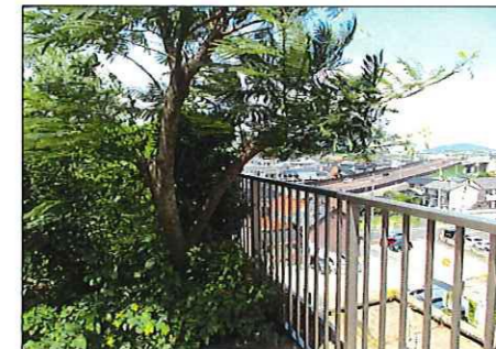
▲屋上公園から跨線橋を望む