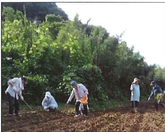
直ぐ、汗が噴き出る