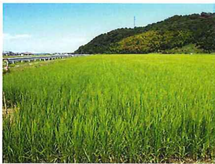
出穂期を迎えた田圃