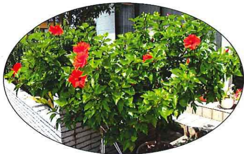
夏の玄関前。鮮やかに咲くハイビスカスの花