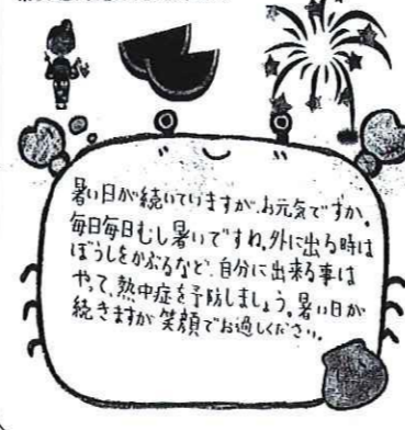
児童が給食弁当と一緒に 手渡したメッセージカード

暑い毎日ですが、お元気ですか？ 私たちは夏休みになり、友だちとたくさん遊んでいます。 楽しい思い出たくさん作ります。