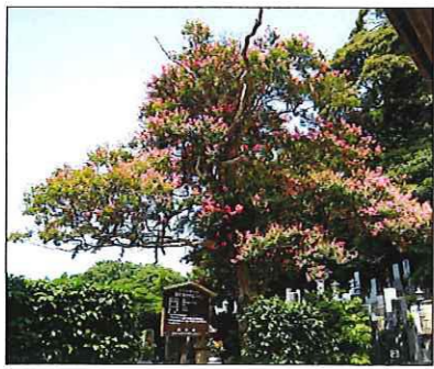
見事な百日紅の大木