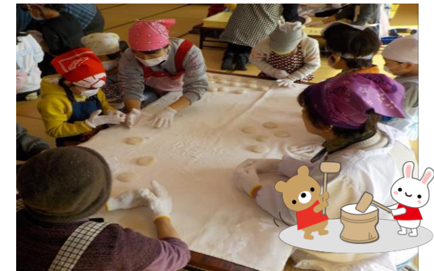
(平成27年餅つき交流会の様子です)

年末と正月の餅つきの理由はそれぞれあり、年末の場合は鏡餅を作るため。鏡餅は歳神様(正月に訪れる神様)に捧げるお供え物。一年を見守って下さる神様に捧げるため、一家総出での餅つきは年末の風物詩になったようです。さて、つきあがった餅は民生委員や福祉協力員の方たちにより、福祉協力員見守り対象者の皆さんのお宅へお届けさせていただきました。鏡餅には歳神様から分け与えていただいた生命力が宿ると言われています。新たな1年の活力をもらうために、ぜひお供えしていただき鏡開きをして食べていただければと思います。