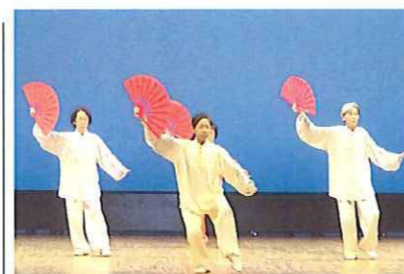
息のあった見事な太極拳の演技

12月2日(土)午後1時から、倉吉未来中心大ホールで芸能発表の部が開かれました。多くの人で空席はほとんどなく、中部地震「福興」の熱気に包まれました。(T)