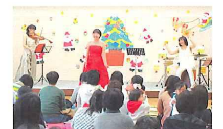
「メアリーズ」さんの演奏