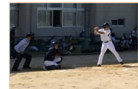
大健闘! お疲れ様でした