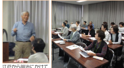
江戸から明治にかけての町の成り立ちや建造物の歴史的価値を学びました。