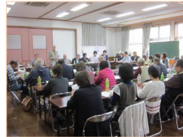
「住民が主体的に地域づくりに参加し支えあう力を育む明倫地区を目標として」