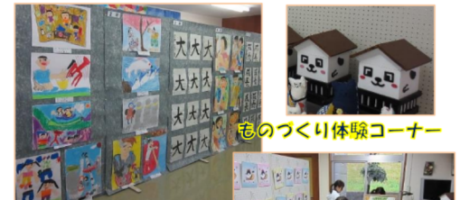
子どもたちの作品