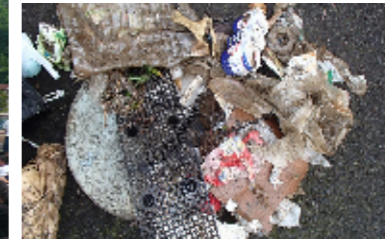
モノを川に捨てないようにしたいものです