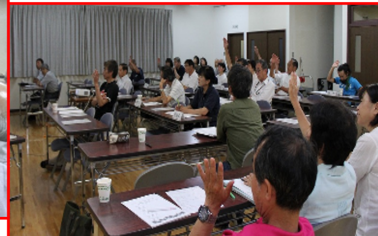
・・・事前学習会の様子・・・

・・・12月 contents・・・★町内学習会を振り返って ★成徳健康フェア おしらせ ★成徳地区青少年健全育成協議会講演会 参加者募集 ★学校へ行こう! ★平成29年緑の募金事業報告★ニュースポーツ「パットゲームスター」参加者募集 ★東中学校ボランティア活動 今年も大成功 ★倉吉市社会福祉協議会長表彰★保健だより★12月おもな予定 ★成徳地区自治公民館協議会 12月のおもな予定 ★第29回倉吉市公民館まつり ★成徳公民館年末大掃除 ★ペットボトルキャップ等回収 ★ベルマーク運動