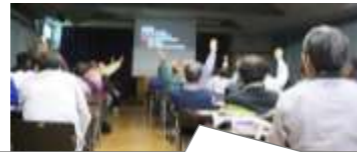
「子どもの頃、川で遊んだ人〜」「は〜い」

身近な自然の素晴らしさに気づくこと、子どもの頃の自然体験の大切さについてお話しいただきました。