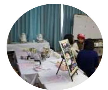
今年も教室・同好会の 作品展示をします。