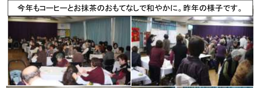
今年もコーヒーとお抹茶のおもてなしで和やかに。昨年の様子です。