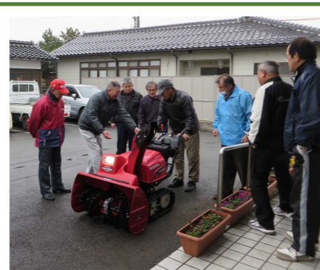
真剣に機械操作を学ぶ 除雪隊のみなさん!

1月現在18名の隊員で活動を開始しましたが、活動内容について周知できていない面がありますので、ご承知いただきご理解とご協力をお願いします。(右写真は、1月22日に実施した除雪機操作講習会の様子です) ○除雪対象は、通学路(三方面学校)を最優先とします。 ○集落内の除雪の依頼につきましては、原則集落での除雪が不可能な単居高齢者宅や高齢者世帯を対象として協力します。 ○除雪依頼は、自治公民館長さんを通して地区公民館に連絡して下さい。 なお、除雪隊は県の【河川・道路ボランティア促進事業】に登録し、市社協のボランティア活動保険に加入して活動をします。今後加入希望者ありましたら、地区公民館へご連絡ください。加入をお待ちしています。