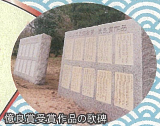
憶良賞受賞作品の歌碑

伯耆国分寺跡北側にある山上憶良歌碑と並んで、憶良賞受賞作品が歌碑として残ります。