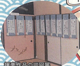
揮毫作品の巡回展

受賞作品を揮毫し、市内で巡回展を開催します。巡回展後は揮毫作品をプレゼントします。