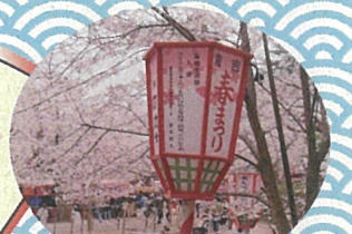
倉吉春まつりのぼんぼり