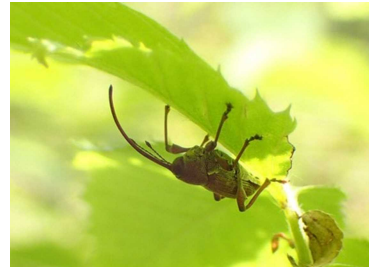
シイシギゾウムシの成虫

①ドングリを水 みず につけ、浮 う いたドングリを取 と り除 のぞ きます。浮 う いたドングリは中身 なかにみ の詰 つ まっていないドングリです。