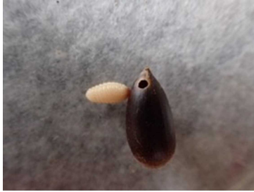
シイシギゾウムシの幼虫とスダジイの実

ドングリを拾ってすぐに工作に使うことはおすすめしません。ドングリの中に白い幼虫 なかにしろようちゅう がいることがあります。それは、「ドングリムシ」ともよばれるチョッキリやシギゾウムシという甲虫 こうちゅう の仲間の幼虫 なかにまようちゅう です(詳しくは打吹山ウォッチングガイドNo.115を参照)。他にも中身が詰ま なかにみつ っていない等 とう の理由 りゆう で、工作に使用 ころさいく できないドングリがあります。ドングリの選別 せんべつ は目視 もくし ではわかりにくいので、次の処理 つぎしより をすることをおすすめします。