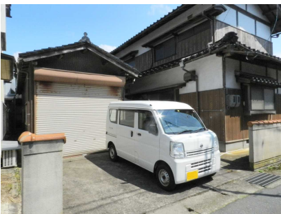
車庫と駐車スペース