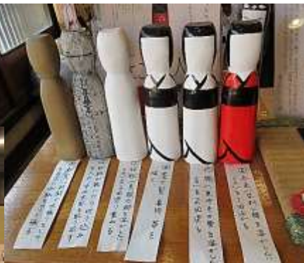
絵付けまでの流れを教えてくださいました。