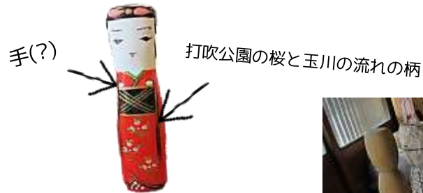
はこた人形工房さん

倉吉博物館の学芸員さんに、はこた人形の絵柄の話をお聞きしたところ、赤い衣装には打吹公園の桜と玉川の流れが描かれており、帯の上の白い丸ははこた人形のルーツではないかといわれている香川県の奉公さんという人形の手の部分に似ていることから、手を表現しているのではないかということでした。