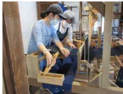
倉吉ふるさと工芸館さん

藍染は虫がつきにくいいため、使い込んで破れた布は、雑巾などに作り替えられ、燃やして虫よけに使うなど、最後まで大切に使われていたそうです。