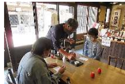
いい所は褒めてくださって楽しく体験することができました！

絵付け体験では実際に、顔を描かせていただきました。体験でははこた人形のほかに起き上がりも作らせていただきました。はこた人形はお手本通りの顔で、起き上がりは個性を出して描いてみました。紙で練習したときはうまく描けていたのに、実際に人形に描いてみると曲面で思うように描けずとても難しかったです。販売されている人形たちはどれも精巧にかわいい顔が描かれていて、すごい技術だなあと感動しました。