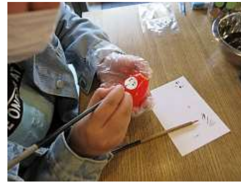
起き上がりは個性を出して世界に一つだけの人形を作ることができました！