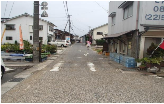
倉吉市鍛冶町1丁目付近