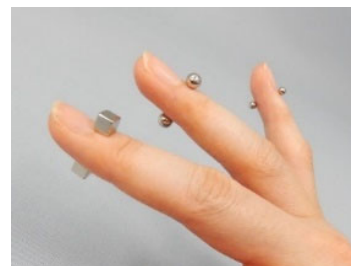
指を挟んでも付く程の強い磁力を持つマグネットボール

マグネットボール、キューブを誤飲すると生死に関わることがあります。少しでも誤飲が疑われる場合には、すぐに医療機関を受診してください。