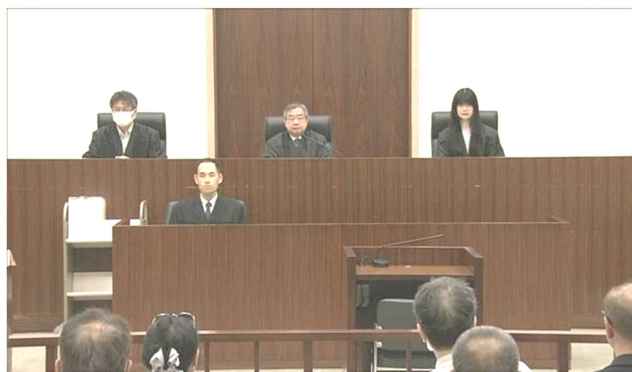
被差別部落の地名公開は権利侵害 1審より広く認定 東京高裁

2021年9月の一審判決では、①の出版禁止の範囲を25都府県に限定②の一覽はすでに被告らが削除済みだと認めず③原告の大半に5500円〜44000円総額約480万円の損害賠償を認めました。 しかし、すべてプライバシー権の侵害で判断しており、原告が求めた「差別されない権利」は認められませんでした。 2021年に控訴、2022年から控訴審での2回の口頭弁論を経て6月28日（水）に高裁判決の言い渡しがありました。