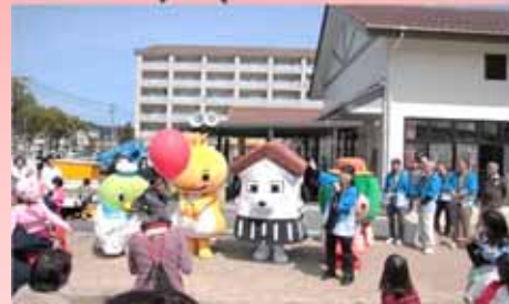
H28年『うわなだ桜まつり』より