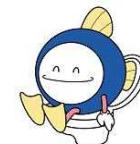
下水道マスコットキャラクター 「スイスイ」