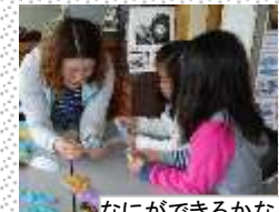
なにができるかな...