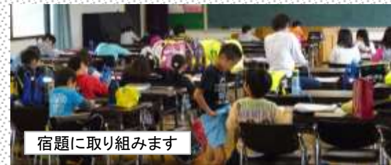
宿題に取り組みます

今年度最初のこうみんかんクラブでした。小学校のPTA総会・保護者懇談の間、47人の子どもたちが公民館で宿題をしたり、ものづくりやぬり絵、将棋、オセロ、トランプ等をして楽しみました。