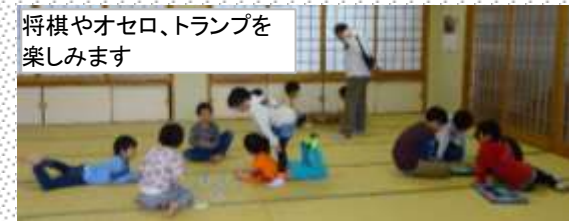
将棋やオセロ、トランプを楽しみます