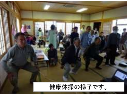
健康体操の様子です。