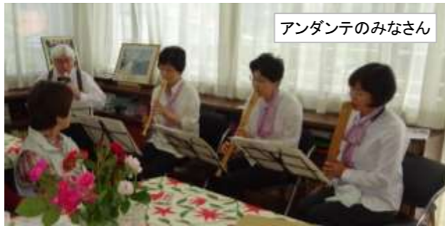
アンダンテのみなさん

男のクラブ「おがもカフェ」・おちゃめクラブ「抹茶席」にて、ミニコンサートがありました。