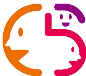
タテ組(シンボルマーク+ロゴタイプ)