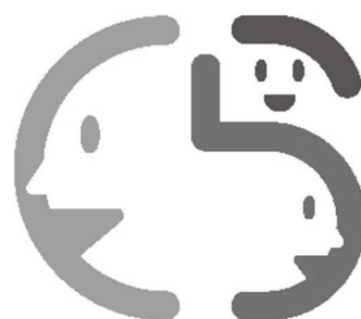
タテ組(シンボルマーク+ロゴタイプ) モノクロ