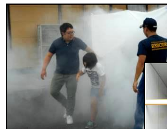
想像以上に 前が見えない~! (煙体験)