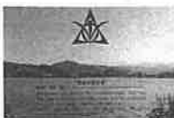
湖南学園校章 (5年生以上)