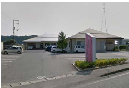
久米の郷さくら診療所 徒歩2分(約190m)