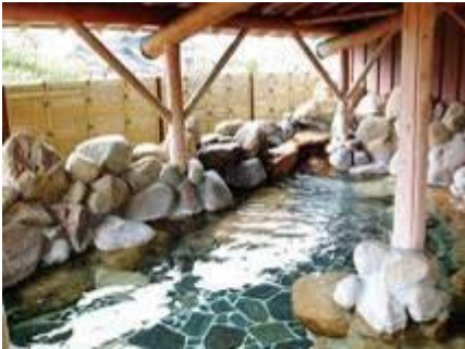
日帰り温泉 せきがね湯命館 車で12分(約8.5km)