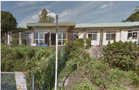
市立社保育園 車で3分、徒歩15分(約1.2km)