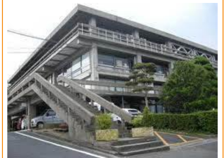
倉吉市役所本庁舎 車で9分(約3.9km)