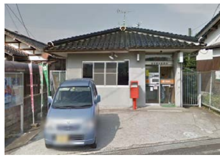
横田郵便局 徒歩11分(約850m)