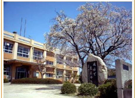
市立久米中学校 車で3分、徒歩16分(約1.2km)