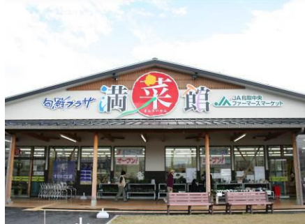
JA直売所「旬鮮プラザ 満菜館」 車で4分(約2km)