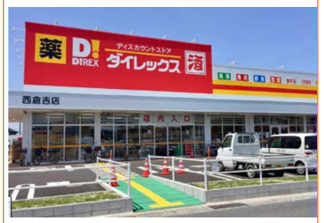
ダイレックス西倉吉店 車で4分(約1.8km)