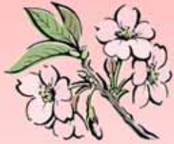
H27 フォトコンテスト 金賞『花の影』