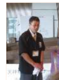
和鋼博物館<島根県安来市>