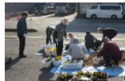
秋の花植え(地区振共催)

花いっぱい明倫地区を目指し、ピオラを植えました。たくさんの参加ありがとうございました。