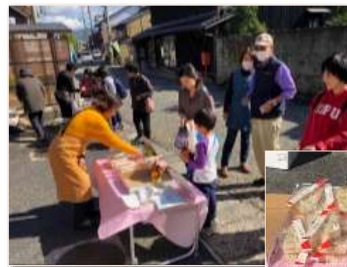
今年も「银杏ご飯」と「さつますティック」が大好評でした☆