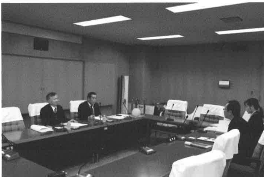
学校適正化について