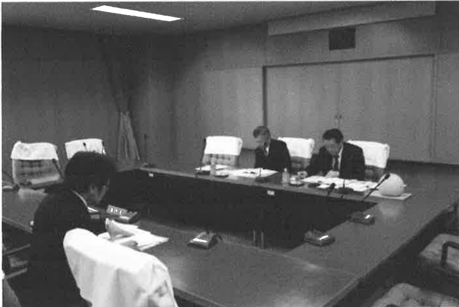
公共交通について

学校の統廃合については地域では賛否が分かれてしまう事が多いが、地域住民との信頼関係を作ることにより、より良い解決がなされると感じた。倉吉市も信頼関係を作ることがこれから努力することだと思う。