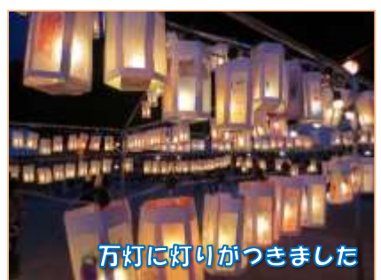
万灯に灯りがつきました