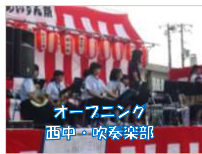
オープニング 西中・吹奏楽部