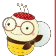
明倫マスコットキャラクター ミードちゃん

明倫地区の庭先養蜂のミツバチをモチーフに、H22年に誕生したオリ ジナルマスコットです。ミードちゃんを知って、可愛がっていただきたく、 明倫公民館でミードちゃんマスコット作りやプラバンパッチ作り 講座などを随時開催しています。ミードちゃんをよろしくお願ひします。 ※「ミード」は英語で蜂蜜酒という意味です。