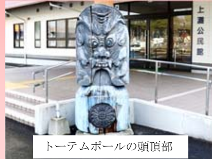
トーテムポールの頭頂部